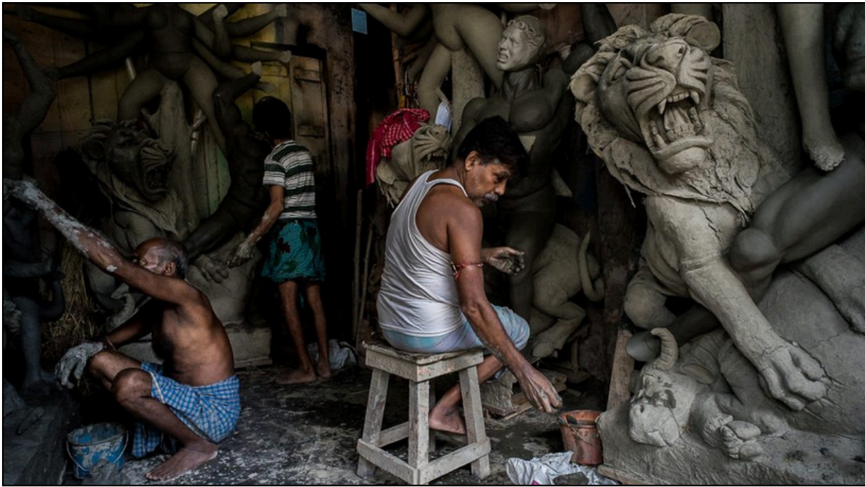
দেৱী দুৰ্গাৰ প্ৰতিমাত শেষ পৰশ, ফটো গুৱাহাটীৰ

ই-সংবাদ, কোকৰাঝাৰ, ১ অক্টোবৰঃ নিৰ্বাচন আহিলেই বিশ্বজিৎ দৈমাৰী চীফ হ'ব বুলি বু-বু-বা-বা চলিছে। কিন্তু বিটিচিৰ মুখ্য কাৰ্যবাহী পদৰ দৌৰত ব্যক্তিগতভাৱে মই নাই। এই মন্তব্য অসম বিধানসভাৰ অধ্যক্ষ বিশ্বজিৎ দৈমাৰীৰ। আজি কোকৰাঝাৰত সাংবাদিকৰ এক প্ৰশ্নোত্তৰত অসম বিধানসভাৰ অধ্যক্ষ বিশ্বজিৎ দৈমাৰীয়ে আৰু কয় যে পৰৱৰ্তী বিটিচিৰ মুখ্য কাৰ্যবাহী সদস্য পদৰ দৌৰত থকা বুলি যিটো বিষয় চৰ্চিত হৈ আছে সেয়া চৰ্চাকাৰীসকলে হে ভালদৰে জানিব। আজিকালি সকলো কথা ৰাজনৈতিক দৃষ্টিৰে চাই আৰু যিহেতু বিজেপি দলে বিটিআৰত কাম কৰি আছে আৰু বিশ্বজিৎ দৈমাৰী যিহেতু বিজেপিৰ সদস্য সেয়ে হয়তো চৰ্চা চলে। ব্যক্তিগতভাৱে মই বিটিচিৰ মুখ্য কাৰ্যবাহী পদৰ দৌৰত নাই। দলে সিদ্ধান্ত ল'ব, মই ক'ত কেতিয়া থাকিব লাগিব। বিধানসভাৰ অধ্যক্ষ হিচাপে মই ৰাজনৈতিক কথা-বতৰা পাতিব নোৱাৰো। চাওতালৰ অলাচিকি লিপিক স্বীকৃতি দিয়া উপলক্ষে কোকৰাঝাৰৰ কচুগাঁৱত অনুষ্ঠিত হোৱা অসম চৰকাৰক ধন্যবাদ জ্ঞাপন সভাত মুখ্য অতিথি হিচাপে অংশগ্ৰহণ কৰাৰ পিছত আজি কোকৰাঝাৰ আৱৰ্ত ভৱনত সাংবাদিকৰ আগত বিপিএফ -ইউপিপিএল মিত্ৰতা সন্দৰ্ভতো কেতবোৰ মন্তব্য প্ৰদান কৰিছে বিশ্বজিৎ দৈমাৰীয়ে। তেওঁ কয় যে বৰ্তমান বিটিআৰত ইউপিপিএল আৰু বিপিএফৰ মিত্ৰতাক লৈ আলোচনা চলি আছে। দল দুটা একেলগ হ'ব পাৰিলে ভাল। কিন্তু সেয়া তেওঁলোকৰ দলীয় বিষয়। ইয়াৰ মাজতে কিন্তু বিজেপি দলেও বিটিআৰত নিজৰ কাম-কাজ কৰি আছে। ইউপিপিএল আৰু বিপিএফ দলে কেনেকৈ আসন ভাগ-বাটোৱা কৰে নাইবা ৰাইজে নতুনত্ব কিবা বিচাৰিছে নেকি আদি বিষয়ৰ ওপৰতো নিৰ্ভৰ কৰিছে বুলি মন্তব্য কৰিছে অসম বিধানসভাৰ অধ্যক্ষ দৈমাৰীয়ে। ইপিনে অহা ডিচেম্বৰ মাহত কোকৰাঝাৰত অসম বিধানসভাৰ শীতকালীন অধিবেশন সম্পন্ন হ'ব বুলি সদৰী কৰিছে অসম বিধানসভাৰ অধ্যক্ষ বিশ্বজিৎ দৈমাৰীয়ে।