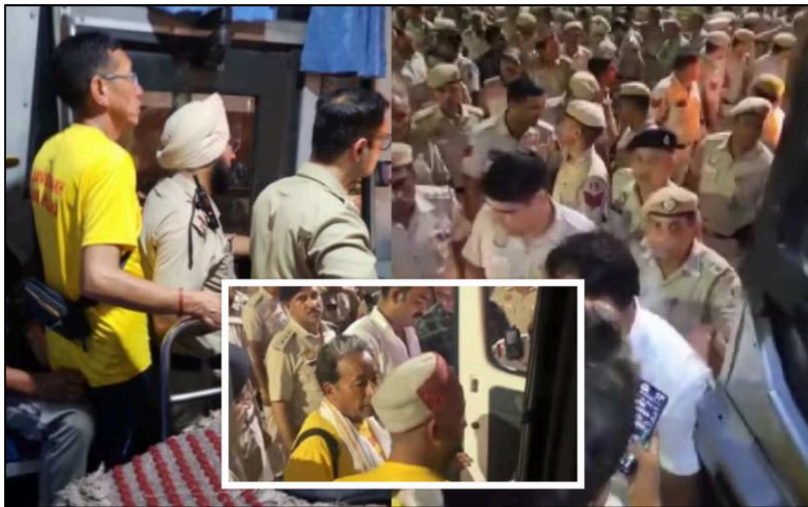
পদব্ৰজে সমদল কৰি দিল্লী পোৱাৰ পিছতে ছোনম ৰাংচুকক সহযোগীসহ আটক, ইনছেটত ৰাংচুক

লাডাখ, ১ অক্টোবৰঃ পূজিপতিৰ আশ্বাসনে ভয়ংকৰ ভৱিষ্যত সংকটৰ সৃষ্টি কৰা লাডাখলৈ চকু নাই প্ৰধানমন্ত্ৰী নৰেন্দ্ৰ মোদী বা কেন্দ্ৰীয় চৰকাৰৰ। ছোনম ৰাংচুকৰ দৰে প্ৰসিদ্ধ জলবায়ু কৰ্মী আৰু স্থানীয় লাডাখবাসীৰ এই ধাৰাবাহিক শান্তিপূৰ্ণ প্ৰতিবাদলৈও কেৰেপ নকৰা নৰেন্দ্ৰ মোদী শেষাংশ ২ পৃষ্ঠাত